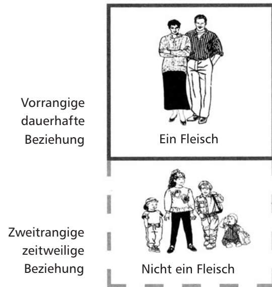
Die gottzentrierte Familie

Gottes Wille steht über allen Entscheidungen. Von jedem Familienmitglied kann erwartet werden, dass es persönliche Wünsche zurückstellt, wenn Gottes Wille dies erfordert. Dieser Grundsatz lehrt die Kinder zu dienen, statt sich bedienen zu lassen; zu ehren, statt sich verehren zu lassen; liebevoll zu geben, statt selbstüchtig zu nehmen. In gottzentrierten Familien wird den Kindern (unter anderem) Folgendes beigebracht: